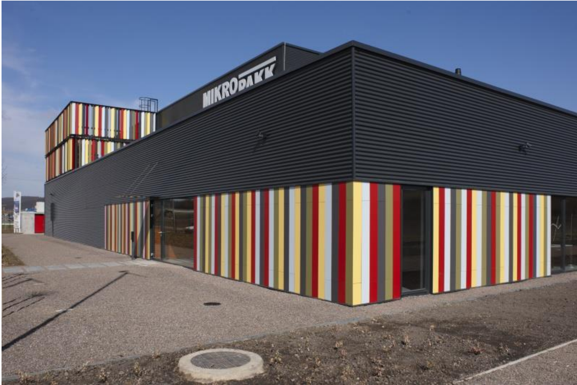
tömegforma | 2_ADDITÍV Pethő László_Mikropakk műanyag feldolgozó üzem