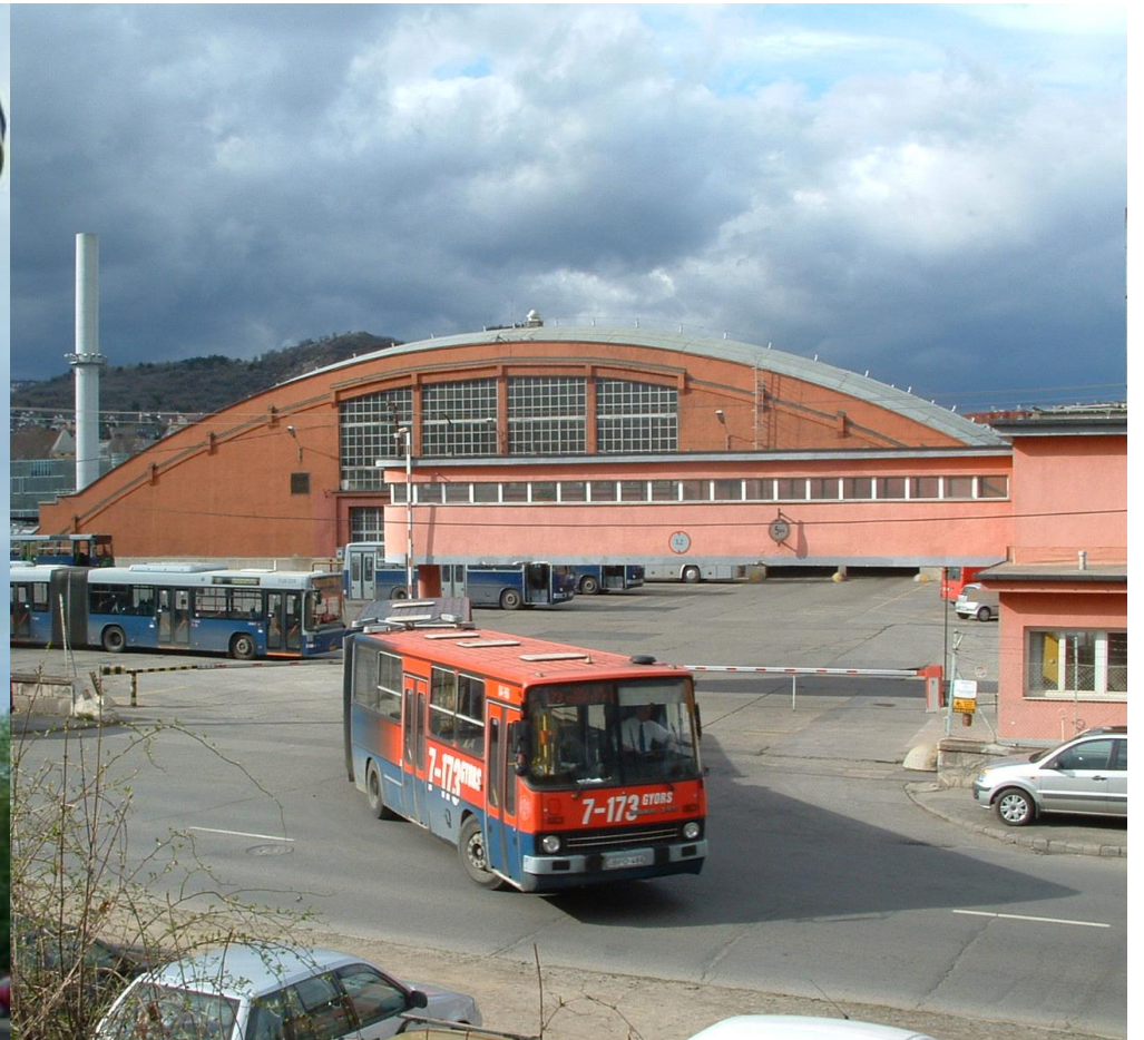
tömegforma | 6_PORTA BKV kelenföldi autóbuszgarázs