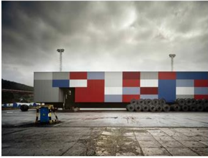
ismagtoma | 1_T06B Baragano_Docks in Aviles