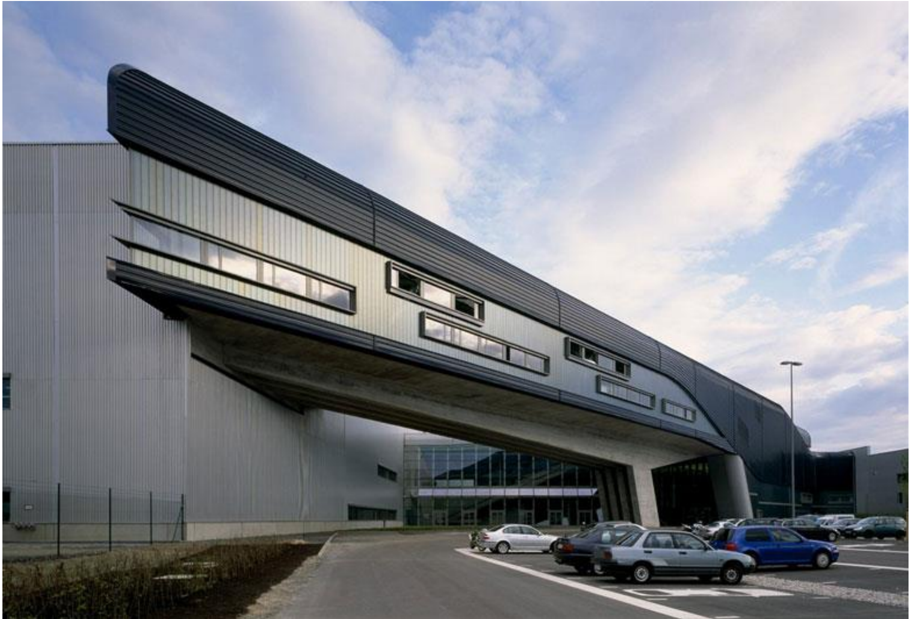
tömegforma | 4_ÖSSZETETT FORMA Zaha Hadid_BMW Central Building