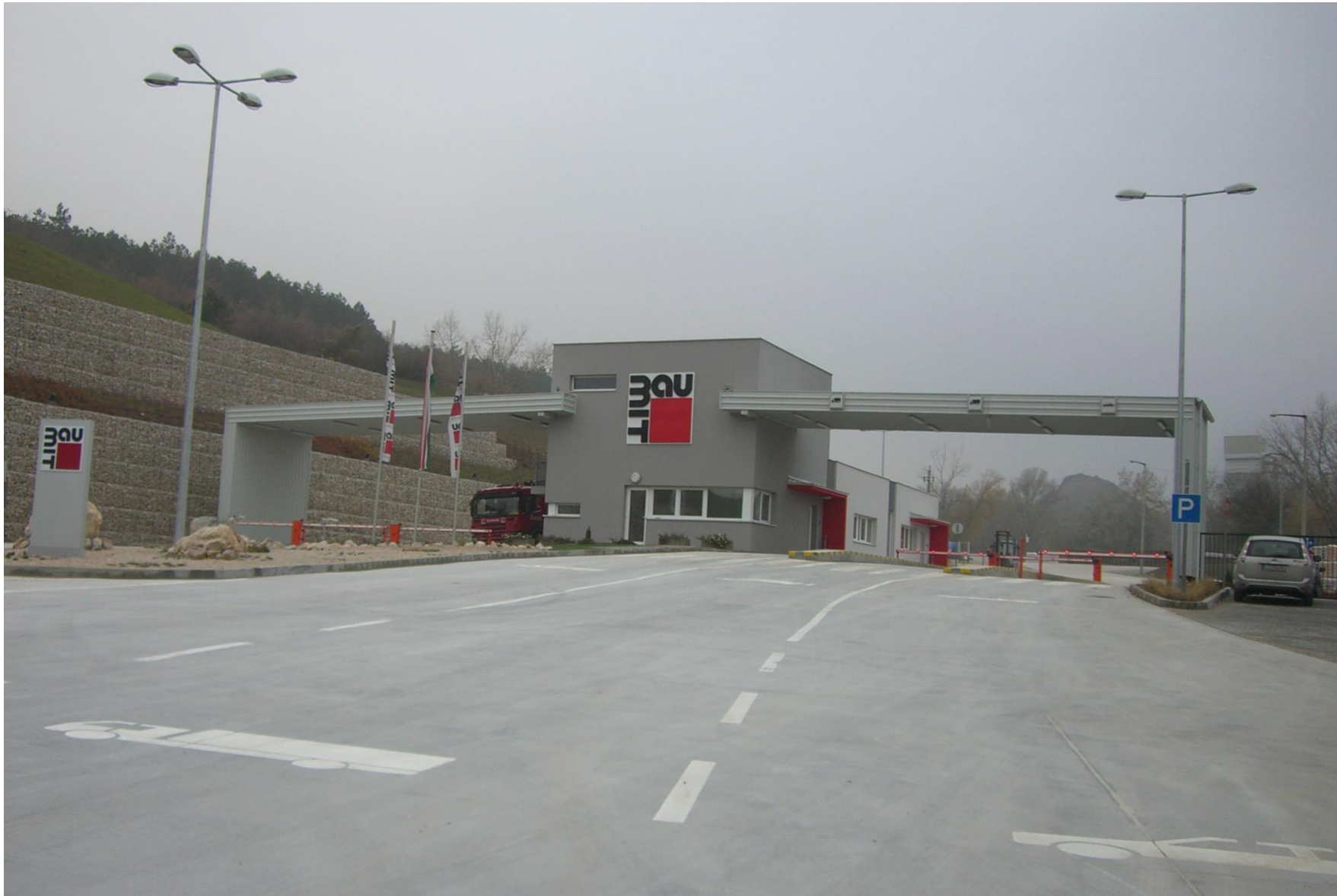
tömegforma | 6_PORTA Baumit kft, Dorog