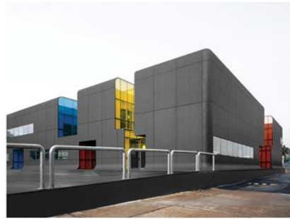
ismagtoma | 3_YURASZTAS_TIBUM SCDII_Bus Center