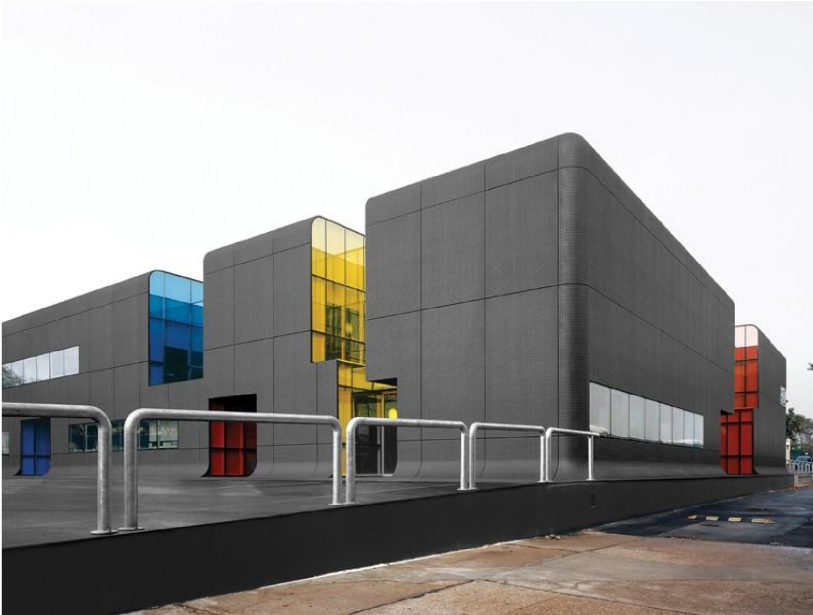
tömegforma | 3_LYUKASZTÁS ECDM_Bus Center