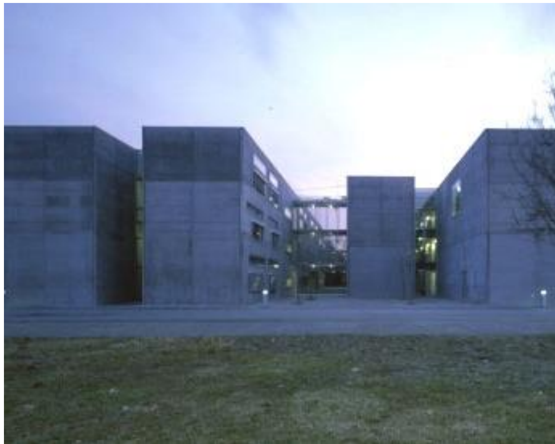
tömegforma | 5_KAPCSLAT Riegler Riewe Architekten_Technical University, Graz