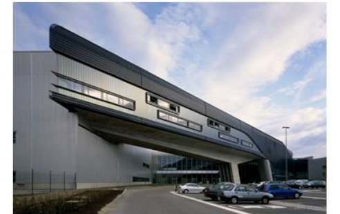
ismagtoma | 4_OSSZETETTFORMA Zaha Hadid_BMW Central Building

http://www.archdaily.com/209911/docks-in-aviles-port-baragano