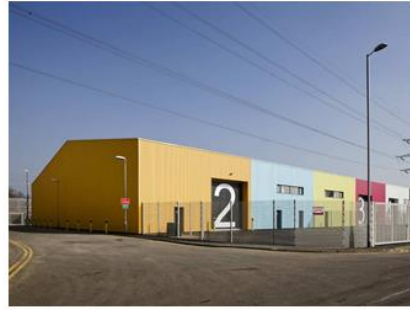
ismagtoma | 1_T06B Alison Brook Architects_wildr