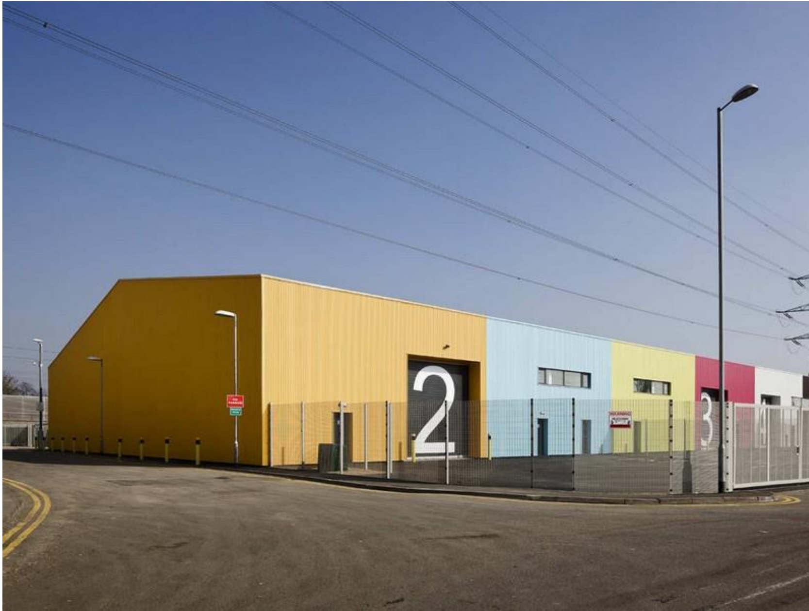
tömegforma | 1_TÖMB Alison Brook Architects_raktár