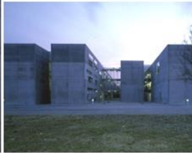
ismagtoma | 3_MAPGLAT Kisgörs Községi Általános Iskola, Győr