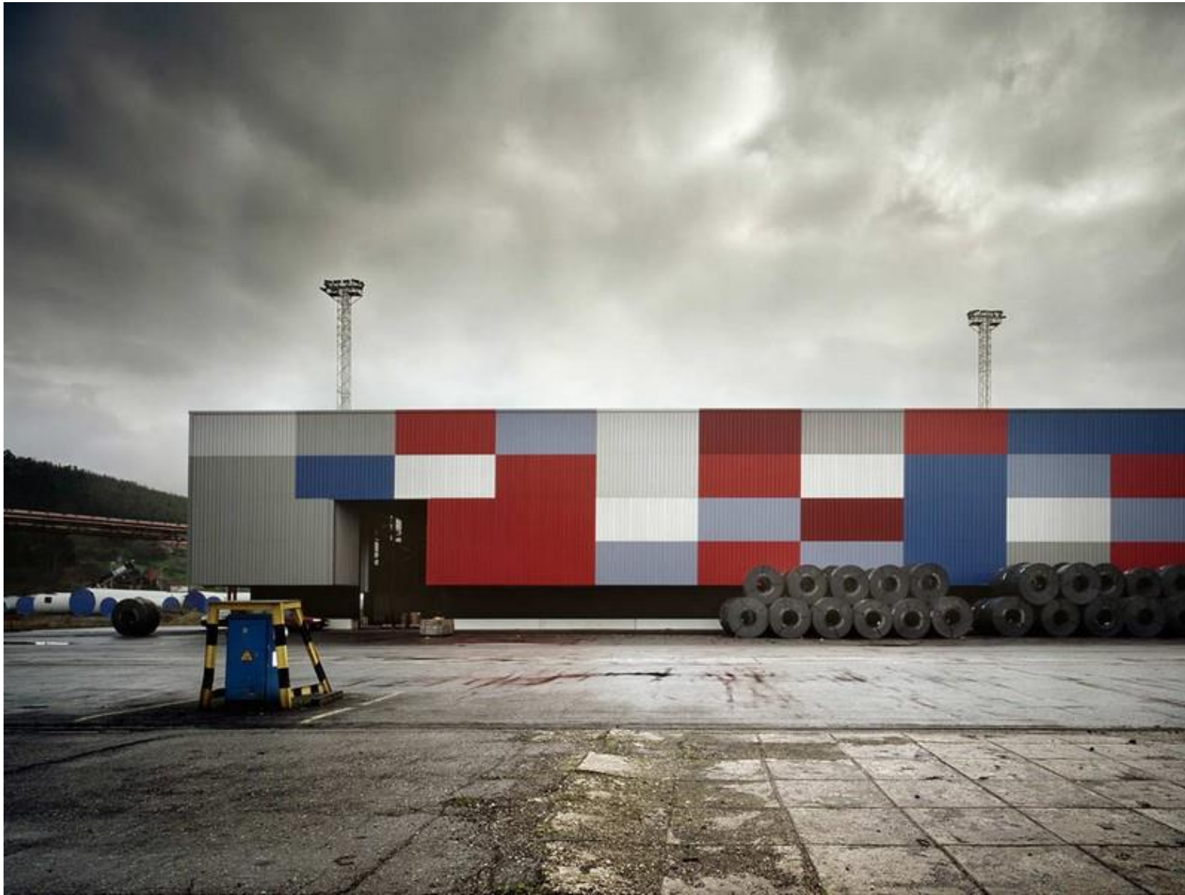
tömegforma | 1_TÖMB baragano_Docks in Aviles