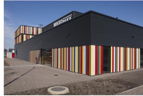
ismagtoma | 2_AGGITIV Pécsi László_Mikroszakk -műanyag felújított uszón